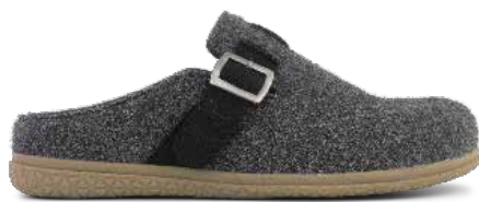
152-56 Gråt filtet ull Lästgrupp M · Strl: 41-47 · ☒