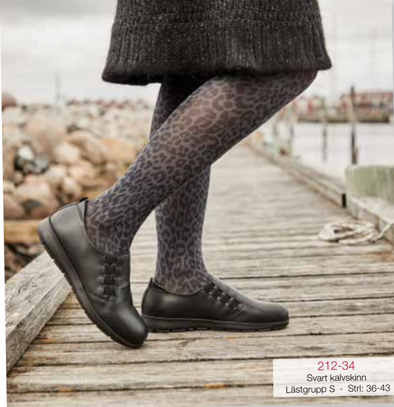
212-34 Svart kalvsinn Lästgrupp S · Strl: 36-43