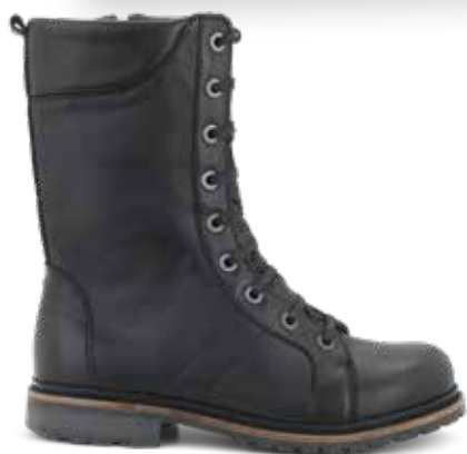
172-14 Hålfotsstöd Svart kalvskinn · Blixtlås Lästgrupp M · Strl: 36-43