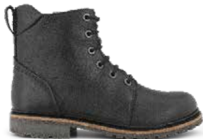
192-55 Hålfotsstöd Svart eller cognac kalvskinn · Blixtlås Picos® membran · Lästgrupp M · Strl: 36-43