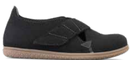
152-26 Svart filtet ull Lästgrupp M · Strl: 41-47 · ☒