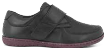
172-40 Svart kalvsinn eller blå oljeimpregnerad kalvsinn · OrthoStretch® Lästgrupp S · Strl: 36-43 · ☞

Alla våra kardborreband kan klippas för att passa just DIN fot !