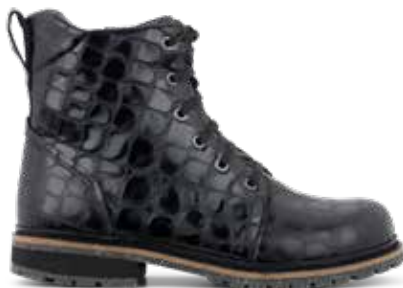
192-55 Hålfotsstöd Svart kalvskinn m. struktur · Blixtlås Picos® membran · Lästgrupp M · Strl: 36-43