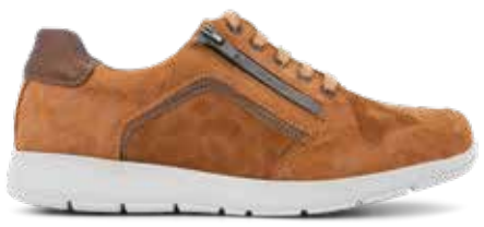
212-18 Natur getskinn m. struktur · OrthoStretch® · Blixtlås Lästgrupp S · Strl: 36-43