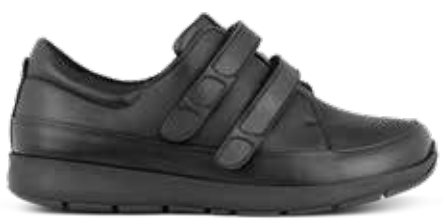
172-08 Svart kalvskinn · OrthoStretch® Lästgrupp S · Strl: 36-43 · ✕