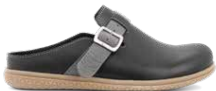
162-79 Svart kalvskinn Lästgrupp M · Strl: 41-47 · ☒