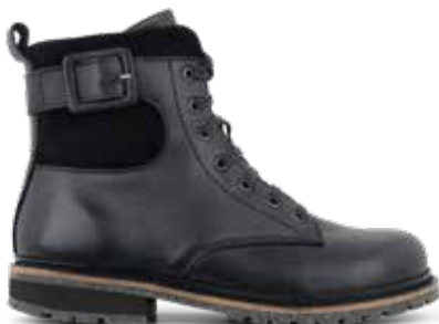
212-10 Hålfotsstöd Svart kalvskinn · Blixtlås Picos® membran · Lästgrupp M · Strl: 36-43