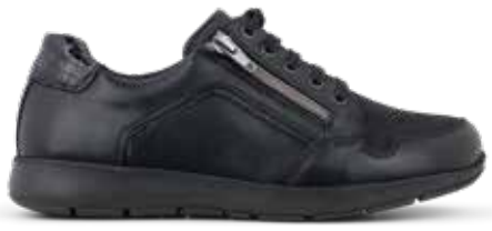
212-18 Svart kalvskinn · OrthoStretch® · Blixtlås Lästgrupp S · Strl: 36-43