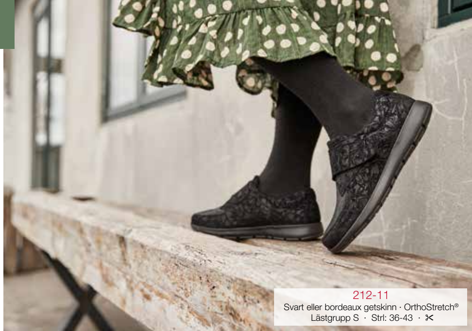
212-11 Svart eller bordeaux getskinn · OrthoStretch® Lästgrupp S · Strl: 36-43 · ✕