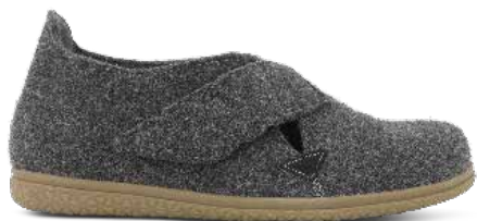
152-26 Gråt filtet ull Lästgrupp M · Strl: 41-47 · ☒