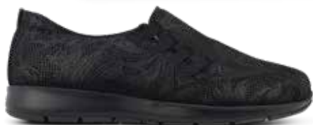
212-34 Svart kalvsinn m. struktur · OrthoStretch® Lästgrupp S · Strl: 36-43