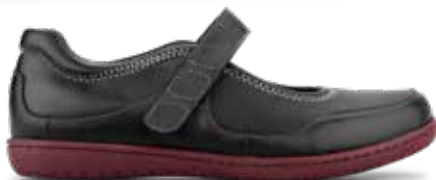
101-16 Sort, blått kalvsinn eller bordeaux getsinn · OrthoStretch® Lästgrupp S · Strl: 36-43 · ☞