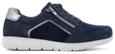
212-18 Blått kalvskinn m struktur · OrthoStretch® · Blixtlås Lästgrupp S · Strl: 36-43